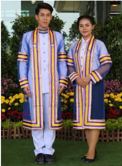
ระดับปริญญาตรี