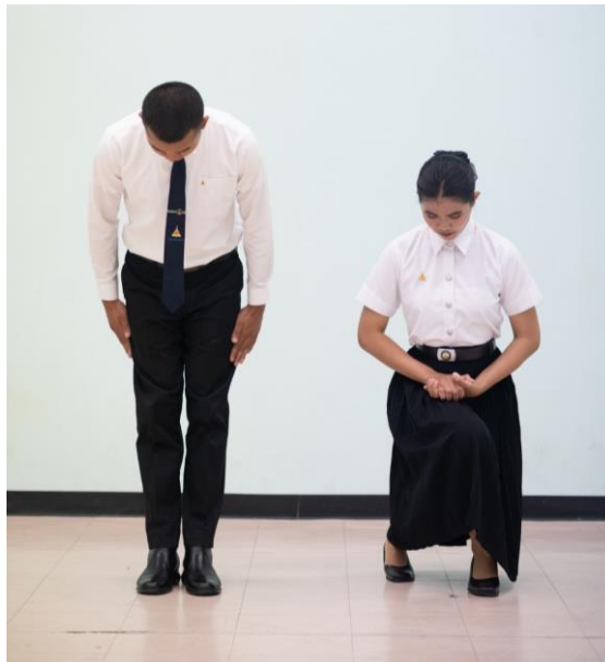
ตัวอย่างการถวายความเคารพ

การเข้ารับพระราชทานปริญญาบัตรของมหาวิทยาลัยอุบลราชธานี บัณฑิตชายให้ถวายความเคารพด้วยการถวายคำนับ (ท่าโค้งคำนับ) บัณฑิตหญิงให้ถวายความเคารพด้วยการถอนสายบัว (แบบพระราชนิยม)