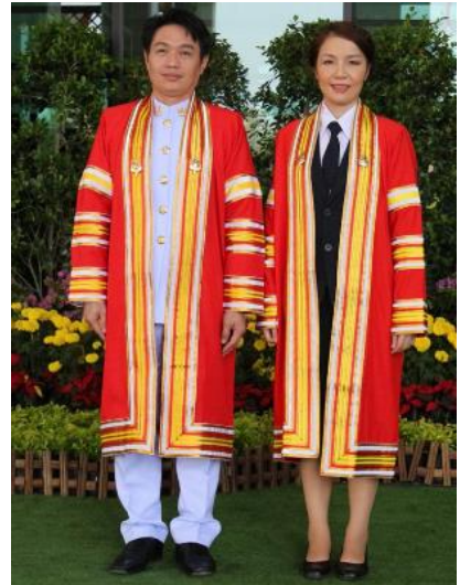
ระดับปริญญาเอก

ภาพ : ตัวอย่างบัณฑิตชาย ระดับบัณฑิตศึกษาข้างต้นเป็นข้าราชการพลเรือน