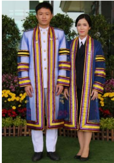
ระดับปริญญาโท